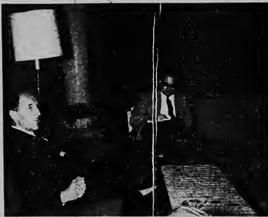
Ministro Luns (na robes) durante e conferencia di prensa ayera merdia den lobby di A.C. Hotel.

ORANJESTAD — E provision di yudanza di Hulanda na Sur-America na promer lugar ta pa Antillas Neerlandes y Surnam, asina ministro J. Luns a declara na nos ayera tardi. Y e ta agrega cu ora cu den e organisacionnan internacional e pregunta worde haci cu kiko Hulanda ta contribui na e paisnan den America Latino, anto Hulanda por muestra riba e yudanza cu e partinan di Reinado den Sur-America ta hanja.